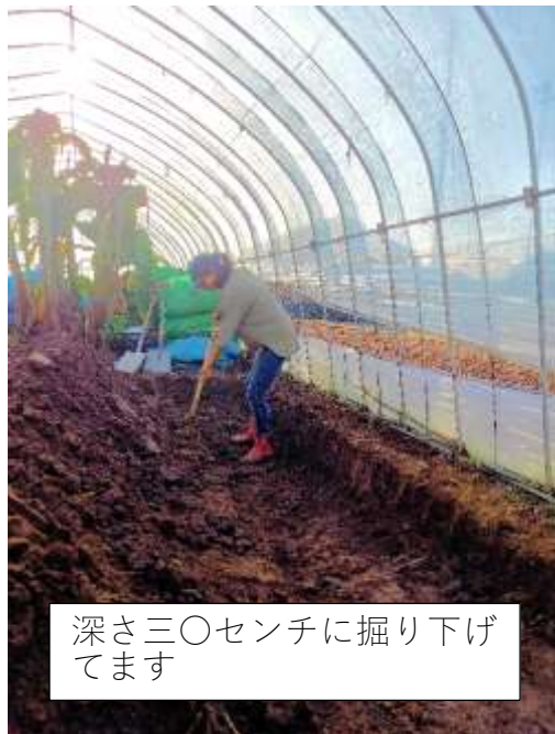
深さ三〇センチに掘り下げ てます