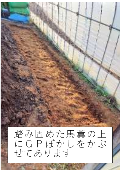
踏み固めた馬糞の上 にGPぼかしをかぶ せてあります