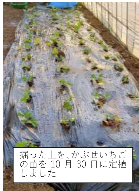
掘った土を、かぶせいちご の苗を10月30日に定植 しました