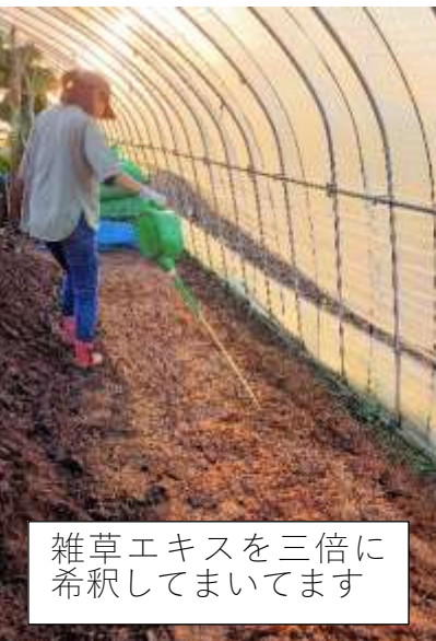
雑草エキスを三倍に 希釈してまいてます