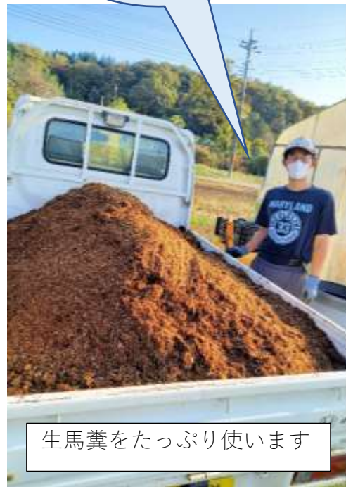
生馬糞をたっぷり使います